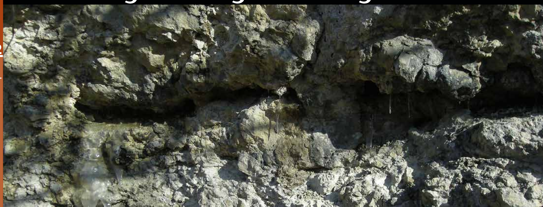
Übergangsbereich zwischen den gebankten und ungeschichtet-massigen Kalksteinen