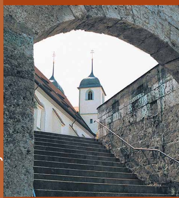
Stiftskirche St. Cyriakus in Wiesensteig

i Stadtverwaltung Wiesensteig Hauptstraße 25 73349 Wiesensteig Tel.: 07335 9620-0 Fax: 07335 9620-24 E-Mail: info@wiesensteig.de Internet: www.wiesensteig.de